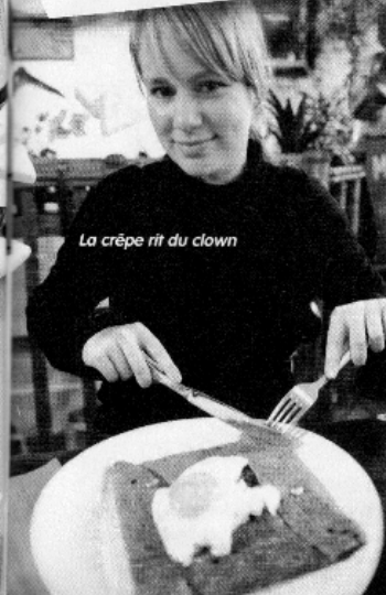
La crêpe rit du clown

Ce petit écrin tout rose ravit les filles qui ont envie de mettre un peu de fantaisie dans leur dressing. On a été séduites par ces silhouettes hyper féminines. Antoine & Lily - 87 Rue de Seine.