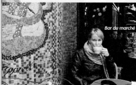
Bar du marché