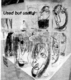
Used but useful